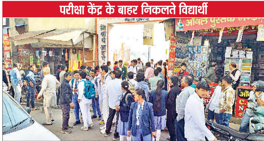
परीक्षा केंद्र के बाहर निकलते विद्यार्थी

10वीं की एग्रीकल्चर, शारीरिक शिक्षा, मीडिया एंड एंटरटेनमेंट सहित अन्य विषयों की परीक्षा और 12वीं का संस्कृत, उर्दू और बायोटेक्नोलॉजी की परीक्षा