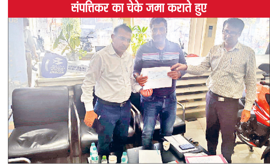
संपत्तिकर का चेके जमा कराते हुए