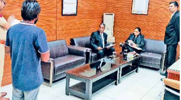
तीन मामलों की सुनवाई करने के बाद तीन बंदियों को रिहा किया गया। इससे पूर्व गत 5 मार्च को आयोजित की गई जेल लोक अदालत में तीन मुकदमों की सुनवाई के बाद तीन बंदियों को रिहा किया गया था। सीजेएम डॉ. तरन्नुम खान ने इस

दौरान महिला बैरक का औचक निरीक्षण किया तथा प्रीमेच्योर पर रिलीज होने वाले कैदियों से संबंधित रिजिस्टर की जांच की। उन्होंने सर्वोच्च न्यायालय व उच्च न्यायालय से संबंधित अपील करने की जानकारी भी मौके पर दी।