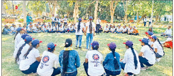
रोहतक। नुककड़ नाटक प्रस्तुत करते एनएसएस के सदस्य।