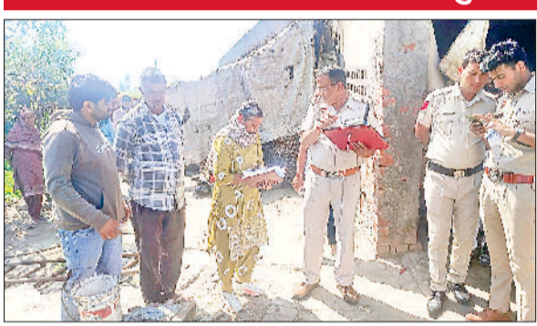
महम: कुई में मिले शव के मामले में जांच शुरू